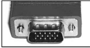
〔ミニ D-sub 15 ピン コネクタ〕