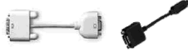
〔付属外部出力ケーブル〕