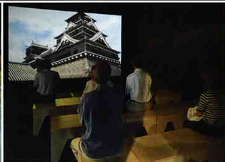
熊本城バーチャルリアリティ 江戸時代中期の高精度CG熊本城VR体験。