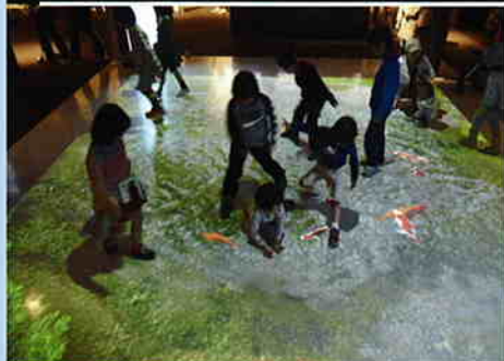
熊本城今昔散歩 現在の地図か箱の地図に、そして不思議な 池が広がって鯉が泳ぎまわります。

義の人 清正 カメラは見た! 明治の熊本 海の大名行列 熊本名水ものがたり くまもと歴史再発見! 肥後偉人伝