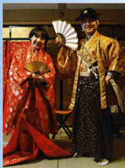
城内なりきり体験 城内イメージ空間で、衣装を羽織って 藩主や奥方気分を味わう。