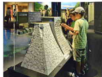
石垣技術体験 熊本城で見られる2つの積み方の違いを体験。