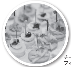
チーズ ワインガー フード